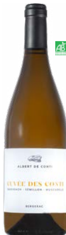
CUVÉE DES CONTI BLANC SEC BERGERAC