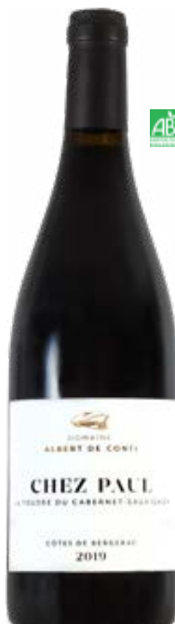
CHEZ PAUL BERGERAC