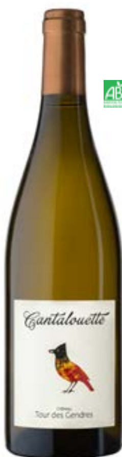
CANTALOUETTE BLANC SEC BERGERAC