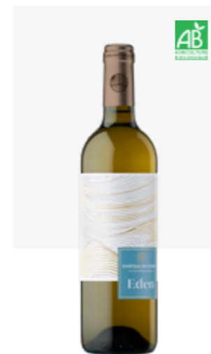
EDEN BLANC SEC Pacherenc du Vic-Bilh sec