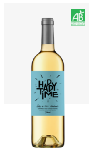
HAPPY TIME MOELLEUX Côtes de Gascogne