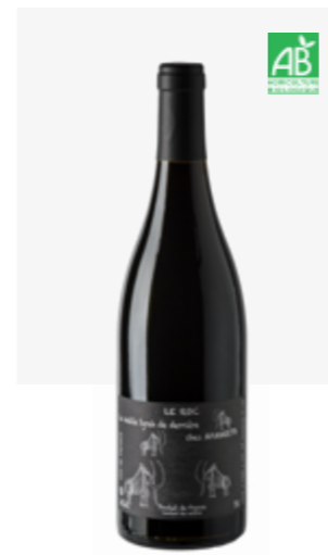
MAMMOUTH VDF Syrah