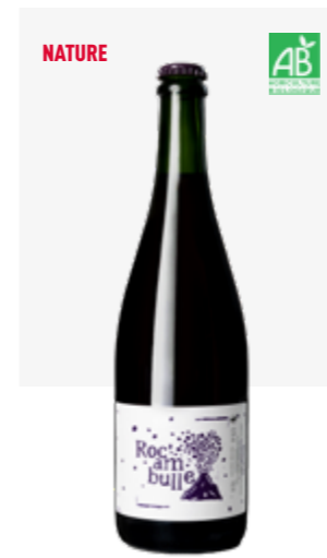
ROC'AMBULLE VDF - Pétillant naturel rosé Négrette