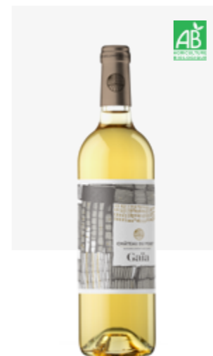
GAÏA Pacherenc du Vic-Bilh (doux)