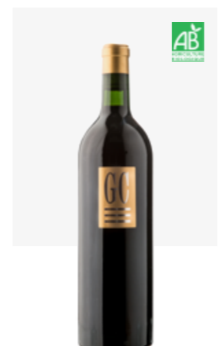
« GC » (GRAND CRU) Cahors Malbec