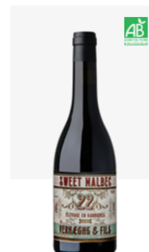
SWEET MALBEC VDL Malbec muté 50cl