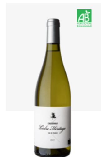
CÈDRE HÉRITAGE BLANC SEC VDF Chardonnay