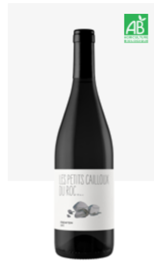
LES PETITS CAILLOUX DU ROC Fronton Négrette, Syrah