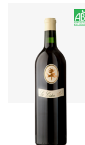
LE CÈDRE Cahors Malbec