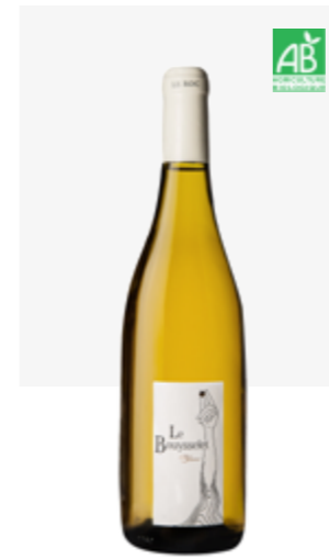
LE BOUYSELET BLANC SEC VDF Bouysselet