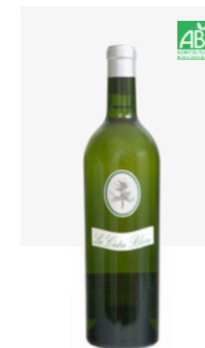
LE CÈDRE BLANC SEC IGP Côtes du Lot Viognier