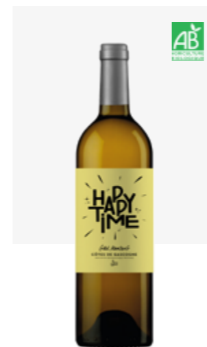
HAPPY TIME BLANC SEC Côtes de Gascogne