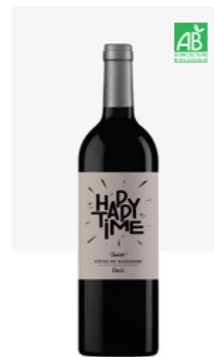
HAPPY TIME ROUGE Côtes de Gascogne