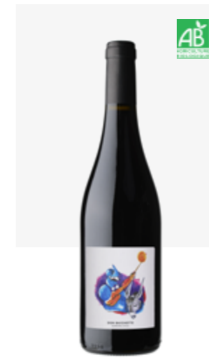
DON QUICHOTTE Fronton Négrette, Syrah