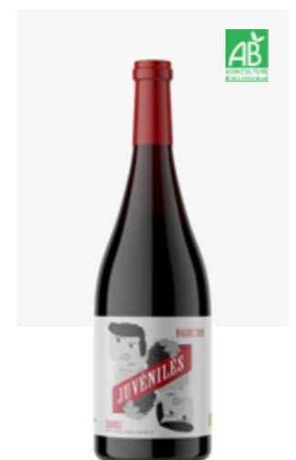
JUVÉNILES Cahors Malbec