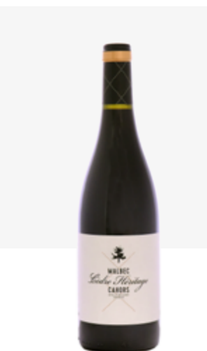
CÈDRE HÉRITAGE Cahors Malbec