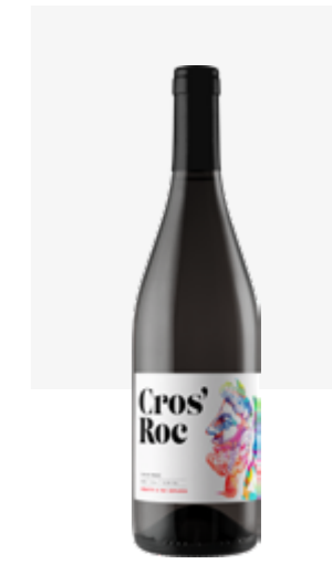
CROS'ROC VDF Négrette, Fer Servadou