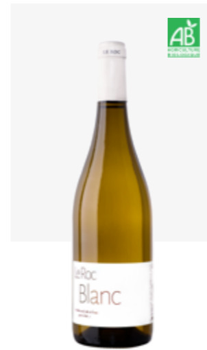
ROC BLANC BLANC SEC VDF Chardonnay, Sémillon, Muscadelle, Vignier