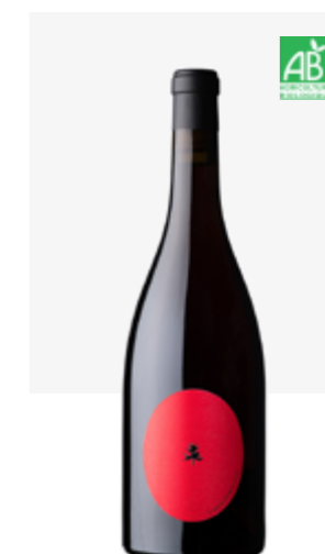
L'IMPROBABLE VDF Malbec