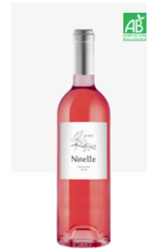
NINETTE Fronton Négrette, Syrah, Cabernets