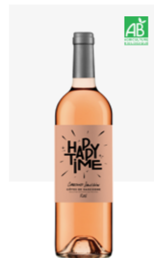
HAPPY TIME ROSÉ Côtes de Gascogne