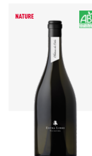
EXTRA LIBRE CHÂTEAU DU CÈDRE Cahors Malbec, Merlot