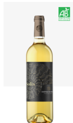
SOLIS Pacherenc du Vic-Bilh (moelleux)