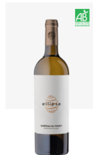
ELIPSE BLANC SEC Pacherenc du Vic-Bilh sec