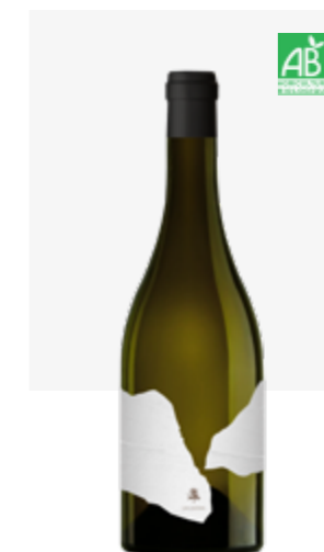
LES GRÈZES BLANC SEC IGP Côtes du Lot Sauvignon blanc, Sémillon, Muscadelle