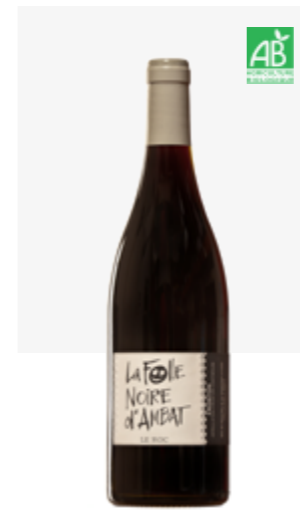
LA FOLLE NOIRE D'AMBAT Fronton Négrette