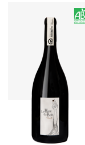
LE HAUT DU BOIS Fronton Négrette