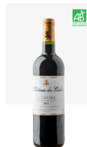
CHÂTEAU DU CÈDRE Cahors Malbec, Tannat, Merlot