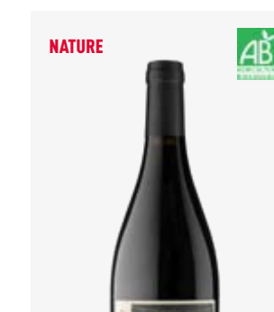
LA VIGNE D'ALBERT Bergerac Périgord, Abouriou, Merlot, Cabernets, Côt, Fer