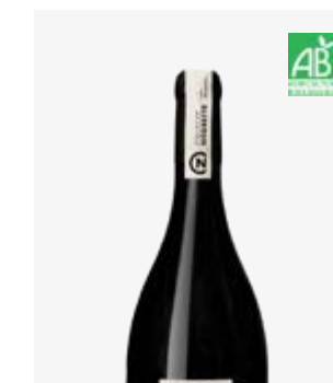
LE HAUT DU BOIS Fronton Négrette