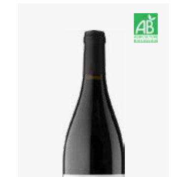
CHEZ PAUL Côtes de Bergerac Cabernet Sauvignon