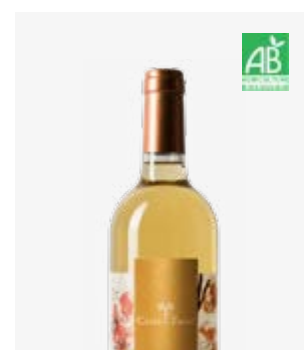
TERROIR DE LA CERISAIE Jurançon (doux) Petit Manseng