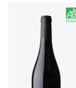
DON QUICHOTTE Fronton Négrette, Syrah