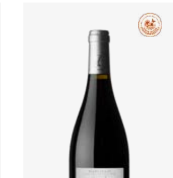
LES ROUGIERS Marcillac Fer Servadou