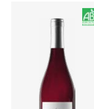
NINETTE Fronton Négrette, Syrah, Cabernets