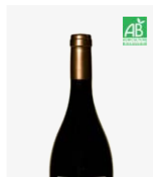
LES ANCIENS FRANCS Côtes de Bergerac Cabernets Franc