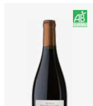
LA GLOIRE DE MON PÈRE Côtes de Bergerac Merlot, Cabernets, Malbec