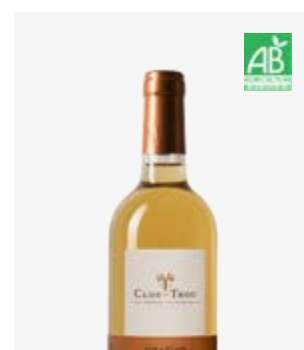
SUPRÊME DE THOU Jurançon (doux) Petit Manseng