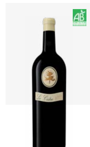
LE CÈDRE Cahors Malbec