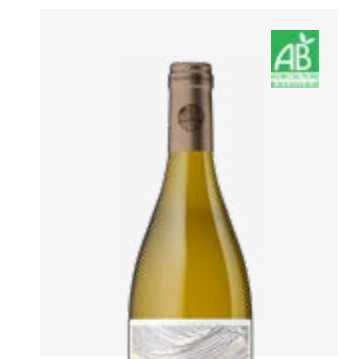
EDEN BLANC SEC Pacherenc du Vic-Bilh sec Gros Manseng, Petit Manseng