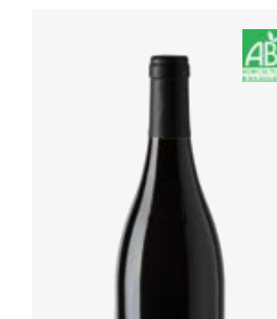
MAMMOUTH VDF Syrah