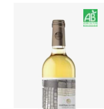
GAÏA Pacherenc du Vic-Bilh (doux) Gros Manseng, Petit Manseng