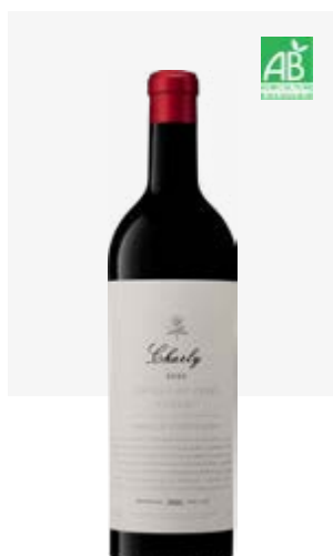
CHARLY Cahors Malbec