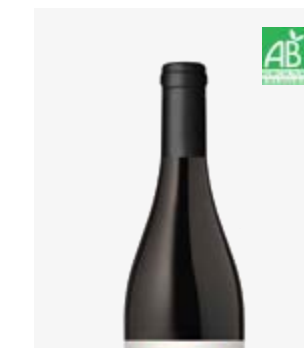
GALAPIA Bergerac Cabernets, Merlot