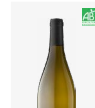
CONTI-NE PÉRIGOURDINE BLANC SEC Bergerac Muscadelle à petit grain