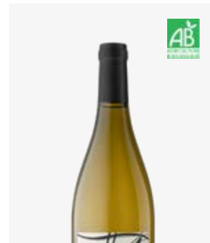
LE VIF BLANC SEC IGP Périgord Savagnin