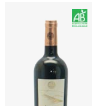
BURDIN HARRIA Iroulégu

Tannat, Cabernet Franc, Cabernet Sauvignon