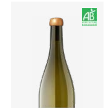
L'INFIDÈLE BLANC SEC IGP Périgord Sauvignon