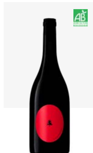
IMPROBABLE VDF Malbec