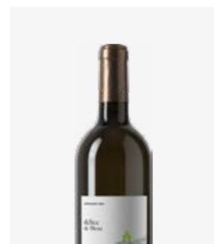
DÉLICE DE THOU BLANC SEC Jurançon sec Petit Manseng, Gros Manseng