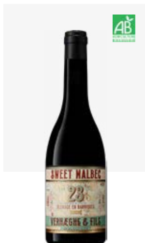
SWEET MALBEC VDL Malbec muté 50cl