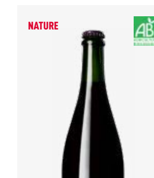
ROC'AMBULLE VDF - Pétillant naturel rosé Négrette