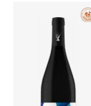
MANSOIS Marcillac Fer Servadou