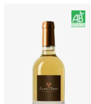
JULIE Jurançon (doux) Gros Manseng, Petit Manseng