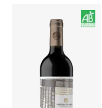
GAÏA Madiran Tannat, Cabernet Franc, Cabernet Sauvignon