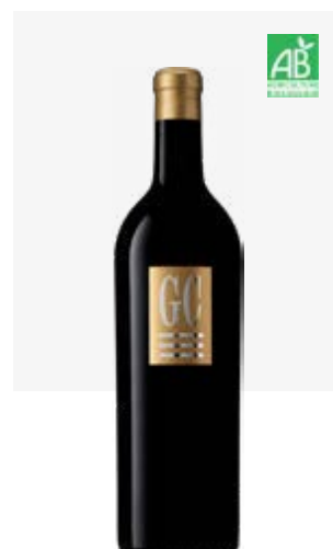
« GC » (GRAND CRU) Cahors Malbec