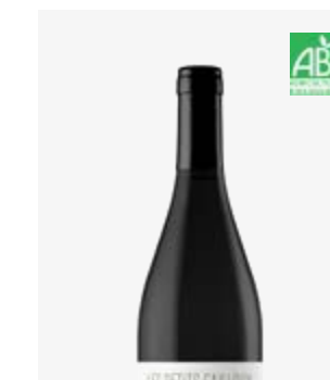
LES PETITS CAILLOUX Fronton Négrette, Syrah