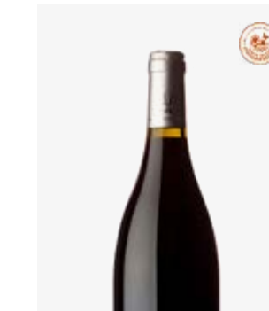
« VV » (VIEILLES VIGNES) Marcillac Fer Servadou