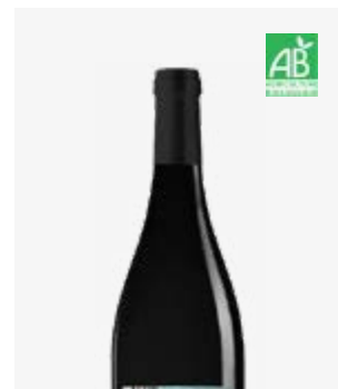
SWING Bergerac Merlot, Malbec