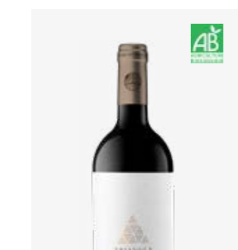
TRIANGLE Madiran Tannat