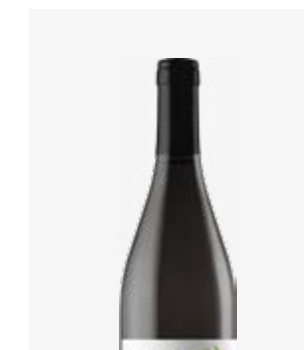
CROS'ROC VDF Négrette, Fer Servadou