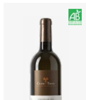
GUILHOURET BLANC SEC Jurançon sec Assemblage 5 cépages