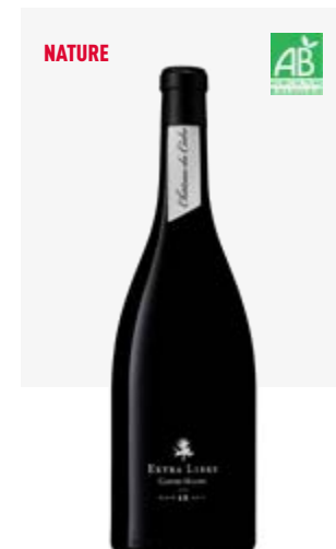
EXTRA LIBRE LE CÈDRE Cahors Malbec