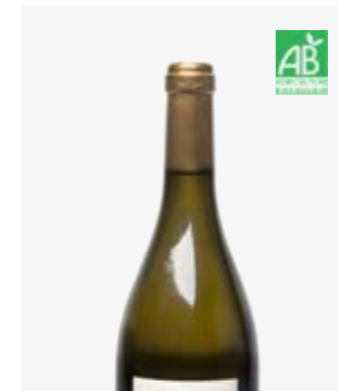
ANTHOLOGIA BLANC SEC Bergerac Sauvignon