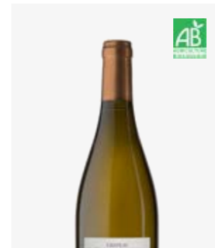
MOULIN DES DAMES BLANC SEC Bergerac Sauvignon