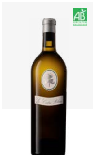
LE CÈDRE BLANC SEC IGP Côtes du Lot Viognier