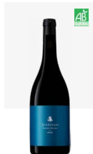
JUVÉNILES Cahors Malbec