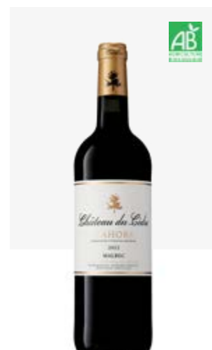
CHÂTEAU DU CÈDRE Cahors Malbec, Tannat, Merlot