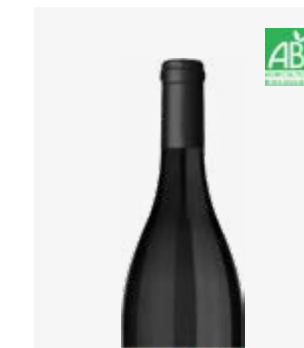
POLYMORPHE Côtes de Bergerac Malbec, Cabernet Sauvignon