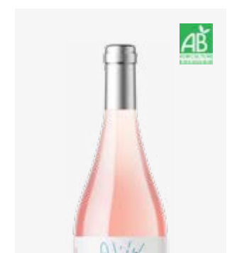
HAPPY TIME rosé IGP Gascogne Cabernet Sauvignon