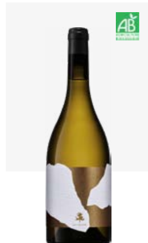
LES GRÈZES BLANC SEC IGP Côtes du Lot Sauvignon blanc, Semillon, Muscadelle