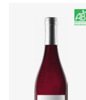
NITA Fronton Négrette