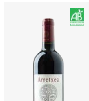
ARRETXEIA ROUGE Iroulégu

Tannat, Cabernet Franc, Cabernet Sauvignon