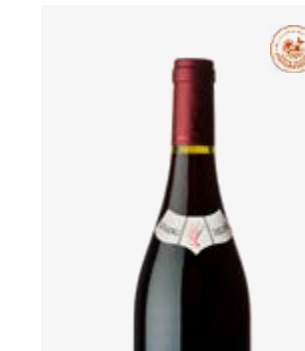
LO SANG DEL PAIS Marcillac Fer Servadou