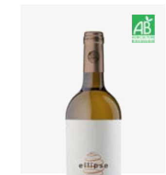
ELIPSE BLANC SEC Pacherenc du Vic-Bilh sec Petit Manseng