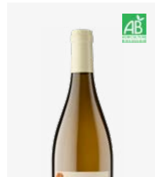
CANTALOUETTE BLANC SEC IGP Périgord Chenin, Sauvignon, Savagnin