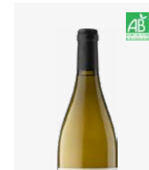
CUVÉE DES CONTI BLANC SEC Bergerac Sémillon, Sauvignon, Muscadelle