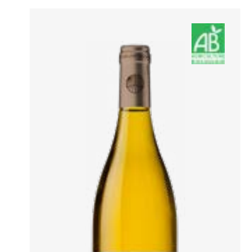
MA PETITE VENDANGE TENDRE VDF Gros Manseng