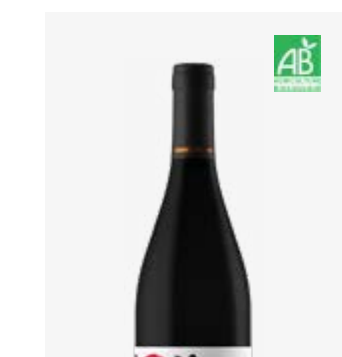
MA PETITE VENDANGE VDF Tannat