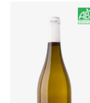
LES PETITS CAILLOUX BLANC VDF Chardonnay, Sémillon, Muscadelle, Vignier