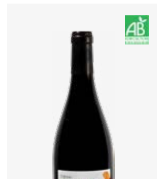
CANTALOUETTE Bergerac Merlot, Cabernet Franc, Malbec