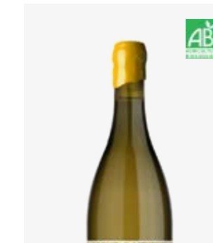
BOIS DE VIE BLANC SEC IGP Périgord Chenin