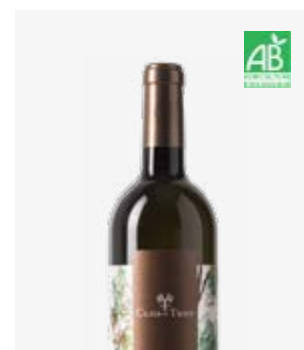
TERROIR DE LA CERISAIE BLANC SEC Jurançon sec Petit Manseng, Petit Courbu, Lauzet