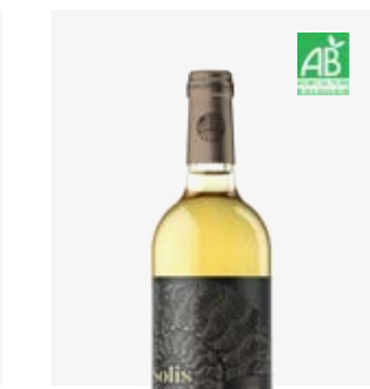
SOLIS Pacherenc du Vic-Bilh (moelleux) Petit Manseng