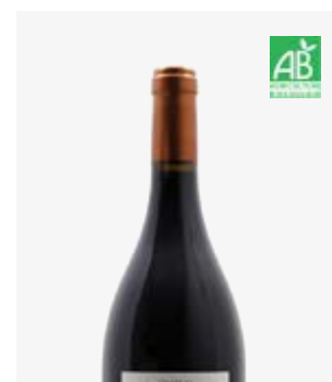
LES GENDRES Côtes de Bergerac Merlot