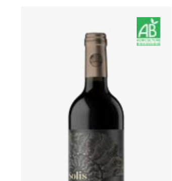
SOLIS Madiran Tannat