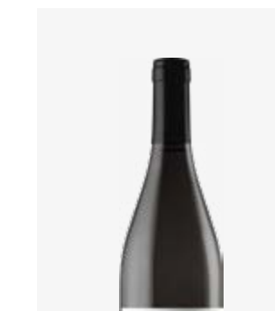
CROS'ROC VDF Négrette, Fer Servadou